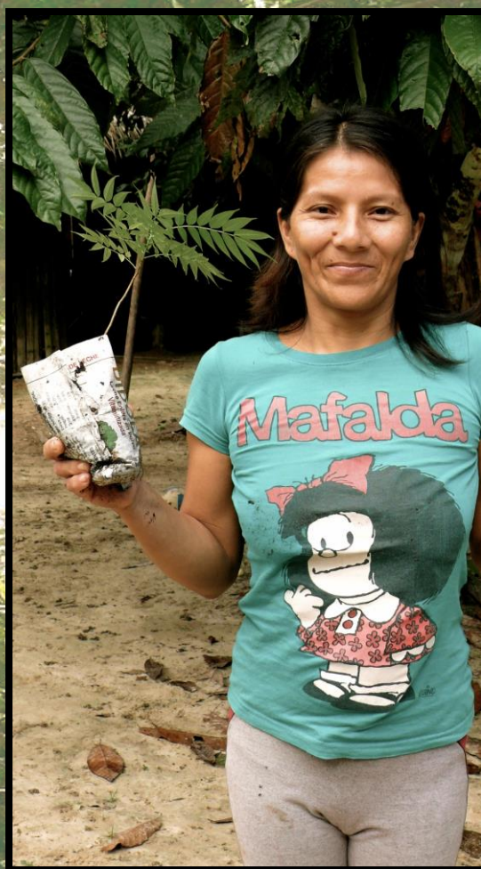
Habitante de la communauté de San Pedro et participante du projet “chacras integrales”